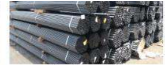
Ống thép đen hàn