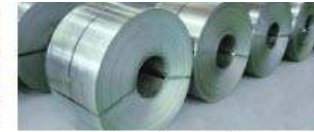
Tôn cuộn mạ kẽm