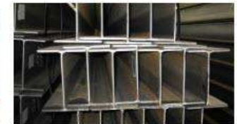
Thép I, thép H