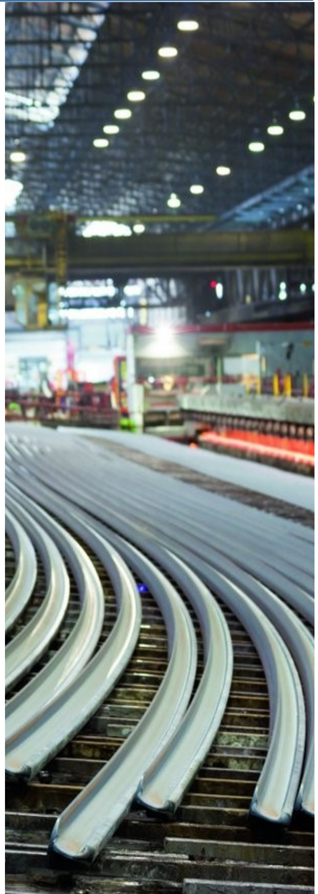
Thép là một ngành hàng xuất khẩu quan trọng của Thổ Nhĩ Kỳ

Theo số liệu từ Cục Thống kê Hoa Kỳ, trong 5 tháng đầu năm nay, Thổ Nhĩ Kỳ đã xuất khẩu khoảng 500 nghìn tấn thép sang Hoa Kỳ so với cùng kỳ năm ngoái con số này là hơn 1 triệu tấn. Do sự sụt giảm này đã làm Hoa Kỳ tụt xuống vị trí thứ ba nhà nhập khẩu thép lớn từ Thổ Nhĩ Kỳ.